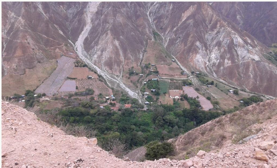
Quebrada seca, al ingreso del poblado, que afecta directamente a la comunidad