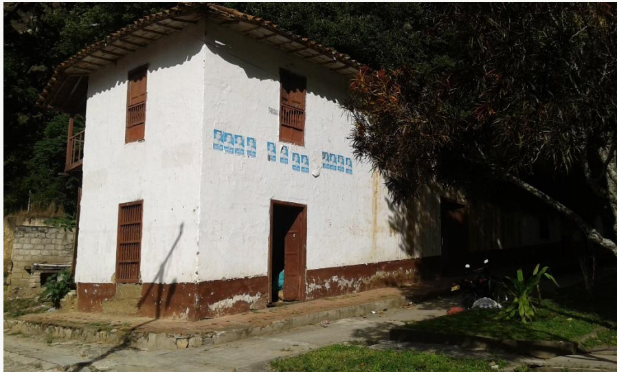
Para una muestra, esta construcción una vez utilizada por oficinas de la administración de Piedecuesta en total abandono (ver imágenes).