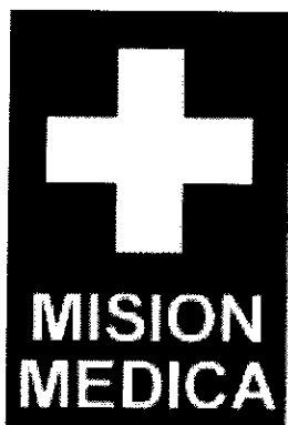
Grafismo del Emblema

Es fundamental un grafismo claro del Emblema para que se identifique fácilmente a las personas y a los bienes que tienen derecho a su utilización y para que, por lo tanto, sean eficazmente protegidos. Sin embargo, la protección no dependerá del uso del Emblema, por lo cual el personal de salud que no estuviese identificada o utilice el Emblema de manera equivocada no perderá por ello su derecho a la protección que se confiere de manera general a la Misión Médica.