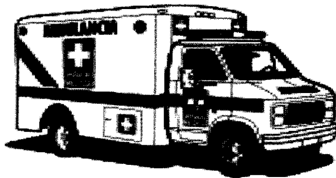
Ejemplo de señalización de ambulancia

Cuando un vehículo se use de manera transitoria, podrá señalizarse por medio de banderas o pendones con el Emblema durante el tiempo que se realice la actividad sanitaria y se retirará la señalización al finalizar la actividad.